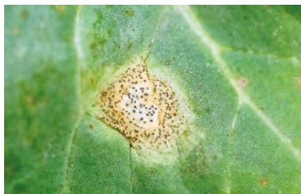
Sucha zgnilizna kapustnych

Nie należy również ignorować suchej zgnilizny kapustnych (zainfekowana nią łodyga rzepaku korkowacieje i łatwo się łamie) oraz szarej pleśni , którą łatwo pomylić z innymi chorobami grzybowymi. Nasiona w porażonych szarą pleśnią łuszczyznach są drobne, niedojrzałe, łatwo się osypują. Przy silnej infekcji całe rośliny mogą się przełamywać i obumierać.